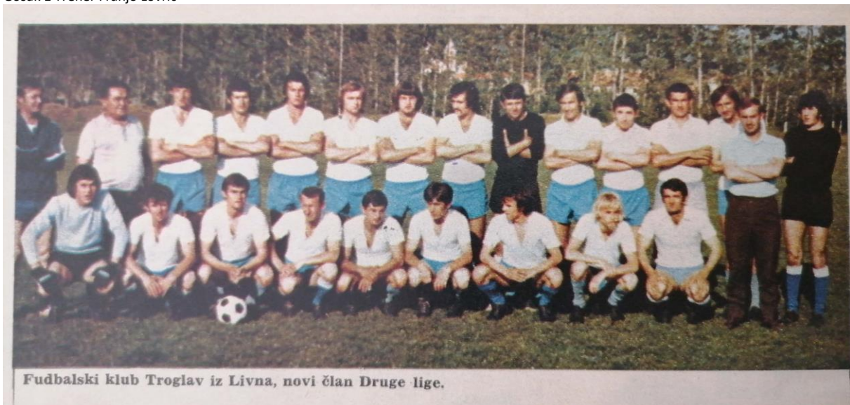
Fudbalski klub Troglav iz Livna, novi član Druge lige.